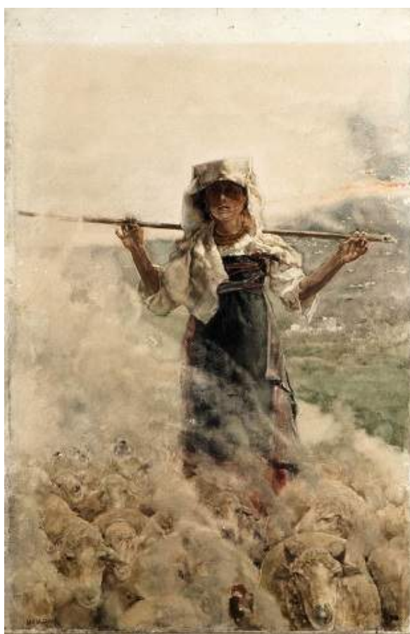
Acuarelas que se pudieron ver en la exposici n temporal del Museo del Prado llevada a cabo en el a o 2011 titulada "Fortuny y el esplendor de la acuarela espa ola".