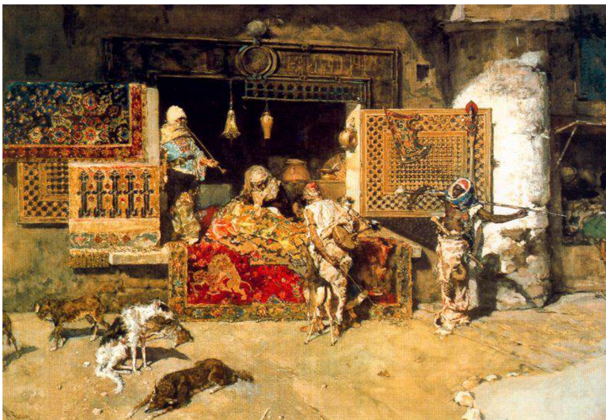
Tapiz saltzailea - El vendedor de tapices. 1870. Acuarela con toques de t mpera sobre papel. 58 X 85 cm